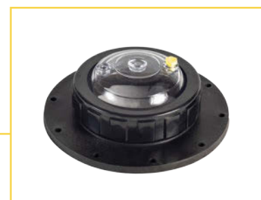
Tapa transparente (OPCIONAL)